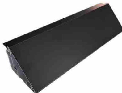
Immagine del campione sottoposto a prova

rispetta i requisiti dell'Allegato I - paragrafo 2.5.1 del Decreto Ministero Transizione Ecologica 23.06.2022 (G.U. n. 183 del 06.08.2022)